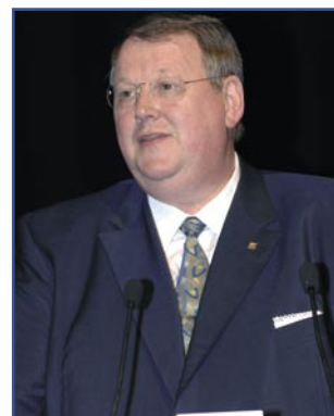
Peter Heesen ... Bundesvorsitzender dbb beamtenbund und tarifunion

Die Steuerverwaltung sei einem Modernisierungsprozess unterworfen. Dem Spannungsverhältnis zwischen Personaleinsparung und gleichmäßigem Steuervollzug müsse somit Rechnung getragen werden. Zur Besoldungserhöhung äußerte er sich positiv, schließlich sei die letzte Anpassung 2004 erfolgt. Geplant seien von der sächsischen Staatsregierung nun 500 EUR Einmalzahlung und eine lineare Erhöhung von 2,9 % im Laufe des Jahres 2008.