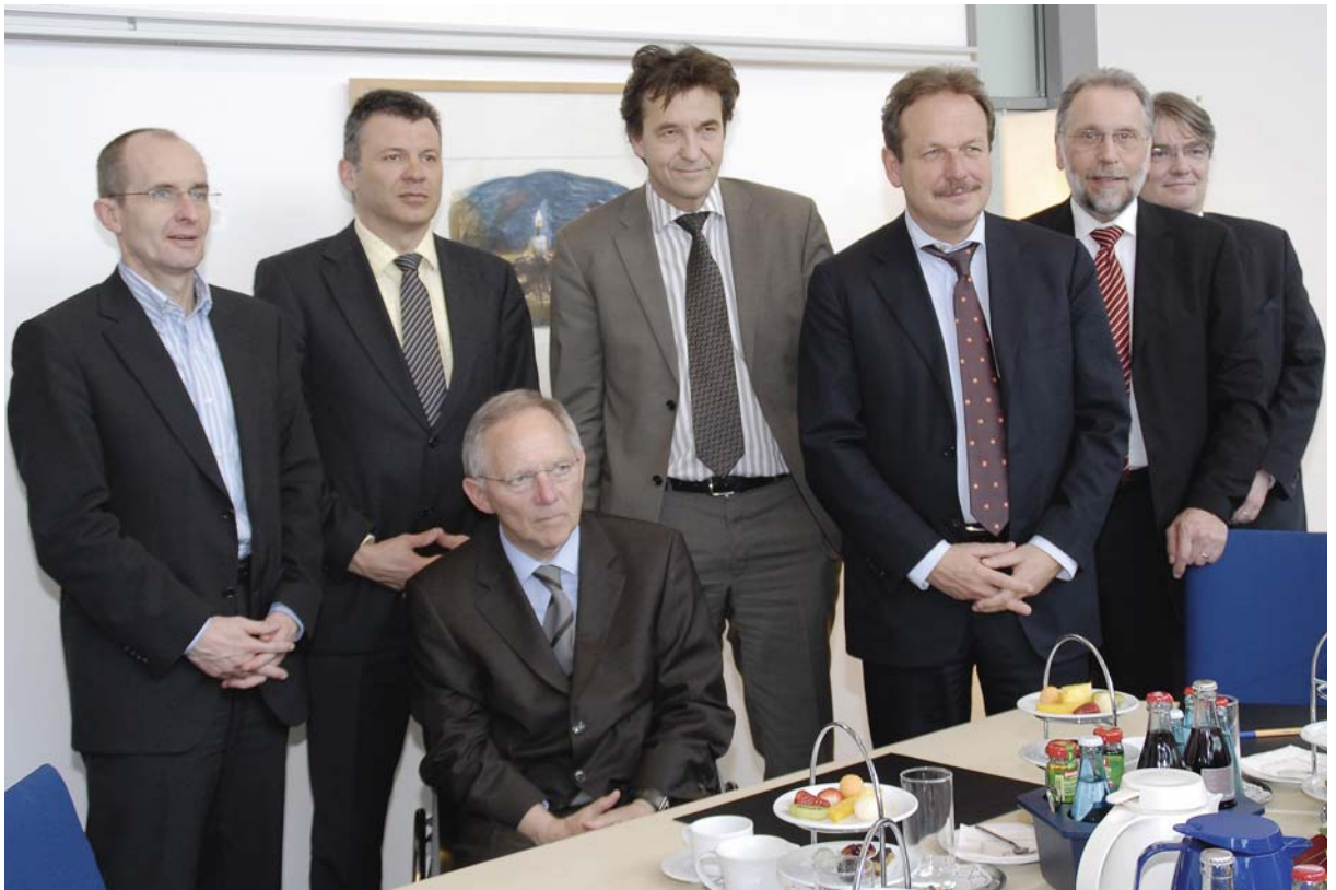
Nach dem Abschluss: Die Verhandlungsführer von Bund, Kommunen, dbb tarifunion und ver.di.